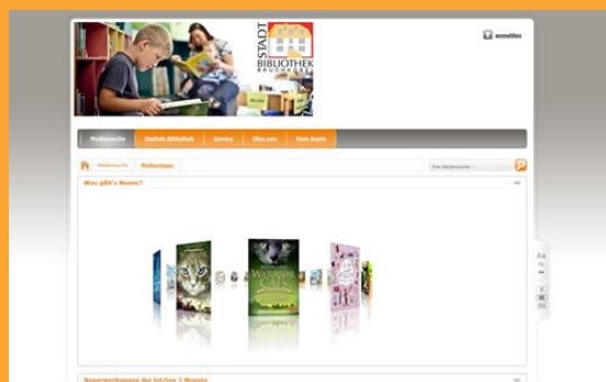
Das neue Katalogportal OPEN http://bruchkoebel.bibliotheca-open.de

Die für die Bibliotheksnutzer offensichtliche Änderung ist der neue Online-Katalog, der sich durch ein modernes Layout auszeichnet: Direkt in der Trefferliste werden die Cover angezeigt. Neue Bücher werden in einem 3D-Karussell präsentiert, häufig gesuchte Begriffe in einer „Schlagwort-