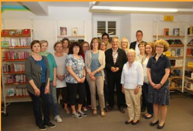
Die Gründungsmitglieder des Fördervereins

Für die Aktivitäten im Bereich Leseförderung haben wir je ein Kamishibai (ein Erzähltheater), Tablet und Notebook gekauft. Mit letzterem können wir Bilderbuchkinos auch außer Haus präsentieren. Das Tablet kann in Klassenführungen eingebunden werden. Ebenso wollen wir Lese-Apps testen.